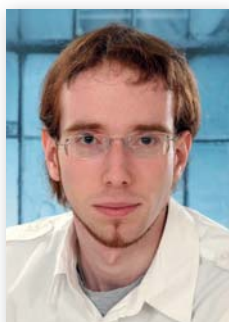
DOMINIK HATZIGMOSER GRAFIK, LAYOUT & BERATUNG

☎ +43 650 / 460 28 54 HELENA@WOHNTRAUMAUTO.AT